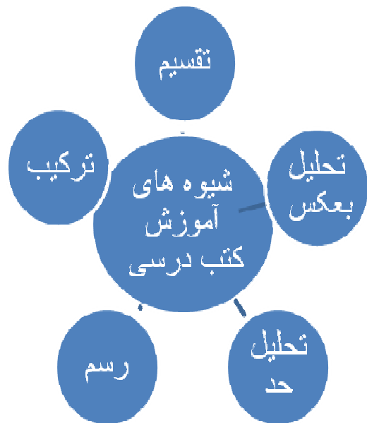
شکل ۱: شیوه های آموزشی در کتب دوران حکیم اهوازی

علی بن عباس مجوسی اهوازی (که به اعتقاد بسیاری خود و پدرش مسلمان بوده اند و اجدادش زرتشتی) کتاب کامل الصناعت را برای انتقال دانش طب به شاگردان و آیندگان تقریر کرده است. طب ملکی حدود چهارصد هزار کلمه و بیست مقاله دارد که هریک مشتمل بر چند فصل است، تقسیم می‌شود که ده مقاله اول آن درباره طب نظری است و بقیه مربوط به طب عملی است (۲). او روش آموزشی نگارشی خود را در تدوین و تقریر این کتاب روش تقسیم معرفی می‌کند (۲ و ۷).